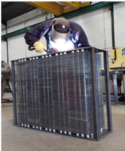
Fabricación en nuestras instalaciones